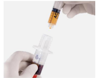
Bereit zur Injektion